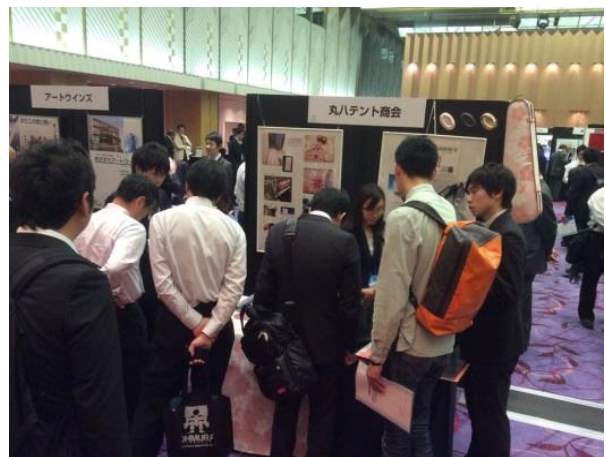
展示会ブース 接客時