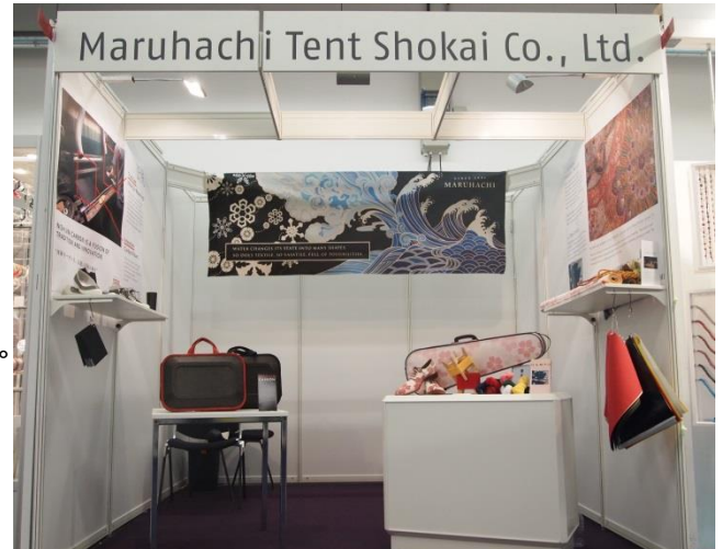
Ambiente 株式会社丸八テント商会 展示ブース